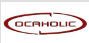
Marc Büchel (Ocaholic.ch, Schweiz)