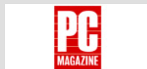
Bart Stoffels (PC Magazine, Niederlande)