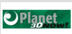
Roland Neumeier (Planet3DNow, Deutschland)